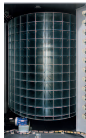
Rullo interno macchina

*Grafiche personalizzabili su richiesta a pagamento.