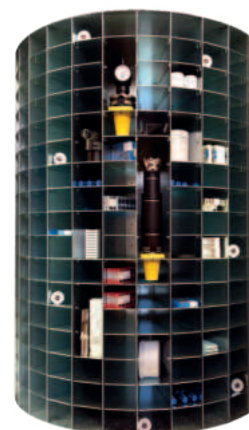
Rullo interno macchina

*Grafiche personalizzabili su richiesta a pagamento.