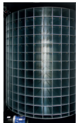
Rullo interno macchina

*Modello disponibile fino ad esaurimento scorte