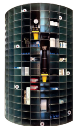
Rullo interno macchina

*Grafiche personalizzabili su richiesta del cliente.